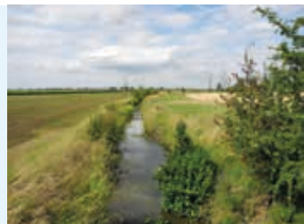
Gewässer mit Gewässerrandstreifen