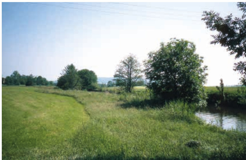
Gewässerrandstreifen mit Beschattung für das Gewässer

Für die einhergehenden Einschränkungen bisher zulässiger und tatsächlich ausgeübter Nutzungen aufgrund der gesetzlichen Vorgaben zum 5m-Gewässerrandstreifen soll nach Maßgabe der verfügbaren Haushaltsmittel ein angemessener Geldausgleich gewährt werden. Die Grundlage für die Ausgleichszahlungen wurde bis Ende 2019 gemeinsam durch die Bayerischen Staatsministerien für Ernährung, Landwirtschaft und Forsten sowie Umwelt und Verbraucherschutz geschaffen. Die geplanten Ausgleichszahlungen sind beihilferelevant, weshalb ein EU-Notifizierungsverfahren erforderlich ist. Die Vorlage der Unterlagen bei der EU-Kommission erfolgte über das Bundesministerium für Ernährung und Landwirtschaft im Januar 2020. Erfahrungsgemäß ist für das Notifizierungsverfahren von Seiten der EU mindestens ein Jahr anzusetzen.